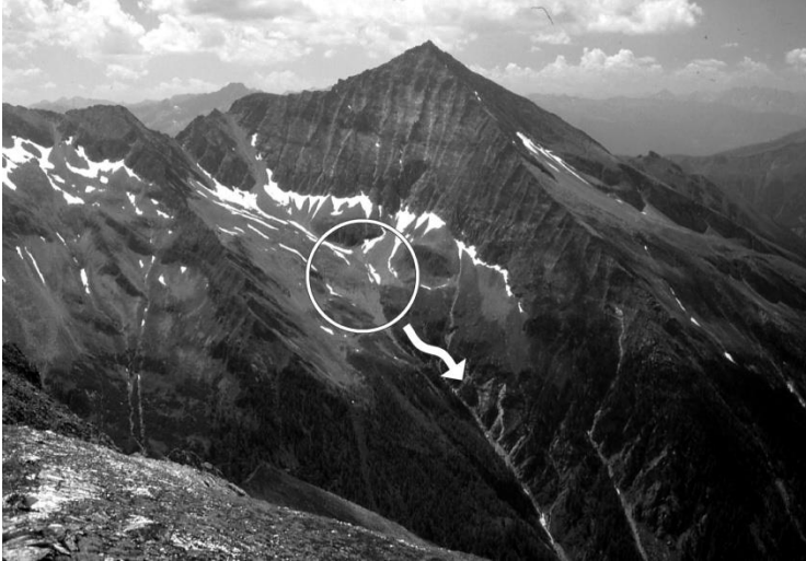
Abb. 2: Vorderes Leitnerkar und Maresensspitz (Ankogelgruppe) von NNE. Der Kreis markiert die Stirn des aktiven Blockgletschers, der Pfeil die mögliche Transportrichtung von freigesetztem Schutt.