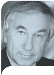
Em.Univ.-Prof. DDr. Gerald Schöpfer Universität Graz

AbsolventInnen eines Universitätslehrgangs oder eines Hochschulstudiums mit einer Gleichhaltung der Sonderausbildung lt. GuKG für Führungsaufgaben der Gesundheits- und Krankenpflege haben die Möglichkeit, in diesem Masterupgrade Stärken und Schwächen in Hinblick auf ihre eigenen Leadership-Qualitäten und die Gesamtzielsetzung zu reflektieren. Sie erlangen wertvolle wissenschaftliche Erkenntnisse, die für ihr eigenes Berufsfeld umgesetzt und genutzt werden können.