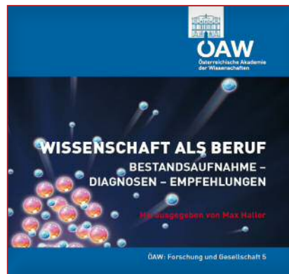
MaxHaller(Hg), Wissenschaft als Beruf. Bestandsaufnahme – Diagnosen – Empfehlungen, Band 5 der Reihe Forschung und Gesellschaft, Wien: Österreichische Akademie der Wissenschaften (2013)

Auf meine Anregung hin wurden dank Unterstützung durch den letzten ÖAW-