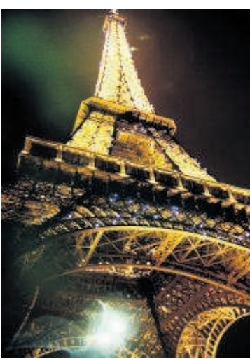
Paris ist nicht mehr so teuer, wie es einmal war: Nr. 37 der Welt

TOKIO. Die japanische Hauptstadt Tokio hat einer Studie zufolge den wenig beneideten Titel der für Ausländer teuersten Stadt der Welt zurückerobert. Luanda in Angola und Osaka in Japan folgen auf der Rangliste der Beratungsfirma Mercer auf den Plätzen zwei und drei. Auf Platz vier steht Moskau, Genf auf Rang fünf. Mit der Euro-Krise sei das Leben in zahlreichen europäischen Städten günstiger geworden. Paris zum Beispiel rutschte zehn Plätze nach unten auf Rang 37, Rom um acht auf 42 und Athen um 24 auf 77. London fiel von Platz 18 auf 25, Wien von Platz 36 auf 48.