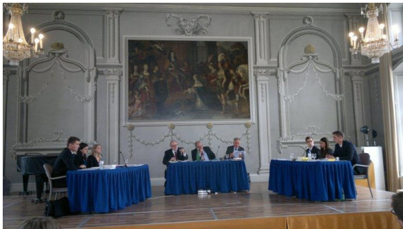
Bundesfinale am 17.06.2014 in Innsbruck.