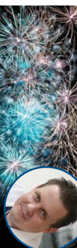
Chirurg Kamolz (M. Bild): Bei Böllern und Raketen nur geprüfte heimische Qualität verwenden. Im Falle eines Unfalls: Rasch ins Krankenhaus, abgetrennte Finger oder Hand unbedingt ins Spital mitnehmen.