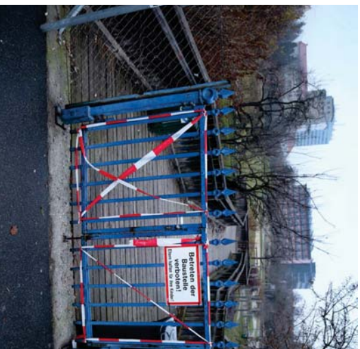
Die Holzbrücke am Oeverseepark in Graz musste nicht winterbedingt, sondern aus bautechnischen Gründen gesperrt werden.

Nitzig: „Das ist aber vor allem deshalb, weil dort Platz fürs Rodeln für Kinder sein muss. Dass wir diese Sperren ausschließen nach dem Kalender vornehmen, trifft daher nicht zu, wir agieren hier sehr flexibel. Man sieht bei verschiedenen Wegen jetzt schon aufgestellte Poller, wo wir dann bei Winterbruch mit Ketten die Wege sperren können. Wenn es Eis und Schnee gibt, dann wird gesperrt.“