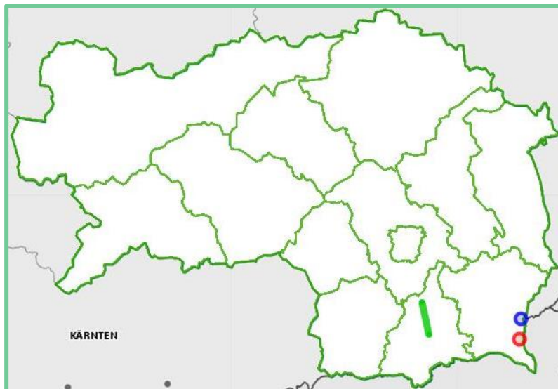
Bild 1: St. Anna am Aigen, Klöch, Wildon bis Leibnitz in der Steiermark. Karte: © GIS-Steiermark.

Lies dir die Überschrift durch. Was denkst du: Worum wird es in diesem Text gehen?