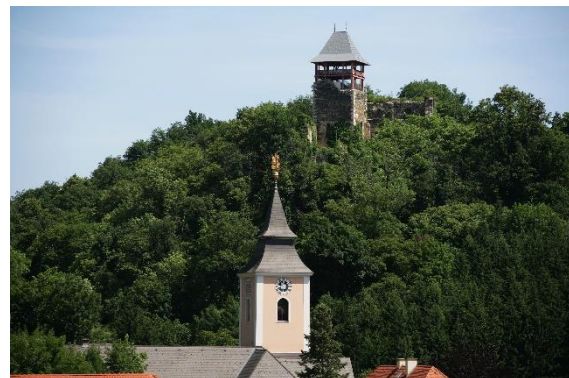
Bild 5: Aussichtsturm Klöch.

Der Tramminerweg ist ein Rundweg , der durch den Ort Klöch führt. Er ist ungefähr 13 Kilometer lang. Das ist ungefähr so weit wie von Wildon bis Leibnitz. Um den gesamten Weg zu gehen, brauchst du etwa fünf Stunden. Es gibt aber auch eine Abkürzung, wenn du nicht den ganzen Weg gehen möchtest. Der Tramminerweg liegt auf Vulkangestein . Auf dem Weg kannst du bei 16 verschiedenen Energieplätzen Kraft tanken oder deine Füße im Klausenbach abkühlen. Es heißt, dass das Wasser eine heilende Wirkung hat und dich gesund hält. Deinen Ausflug kannst du mit einem Aufstieg auf den Aussichtsturm in Klöch verbinden. Er ist 35 Meter hoch, also in etwa so hoch wie ein 10-stöckiges Hochhaus. Von oben hast du eine wunderbare Aussicht auf die Weinberge.