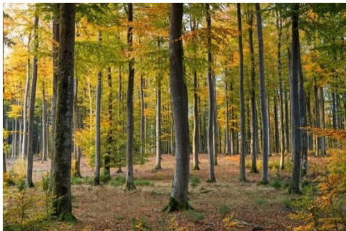
Bild 5: Laubwald.

Laub sind Blätter. Laubwälder sind Wälder mit Laubbäumen. Das sind Bäume mit Blättern. Auf dem Bild siehst du einen Laubwald .