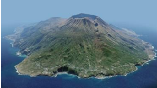
Bild 7: Vulkan.

Das Vulkanland ist ein Gebiet in der Steiermark. Es heißt so, weil es dort früher viele Vulkane gab. Ein Vulkan ist ein Berg, aus dem Lava herauskommt. Lava ist sehr heiß und besteht aus geschmolzenen Steinen. Auf dem Bild siehst du einen Vulkan.