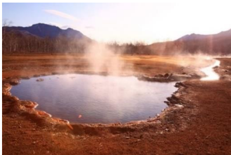
Bild 6: Thermalbad.

Das Thermalbad wird auch oft Therme genannt. Das Wasser für die Schwimmbecken kommt von heißen Quellen tief unter der Erde. Dieses Wasser ist für deinen Körper gesund. Im Wasser kannst du entspannen.