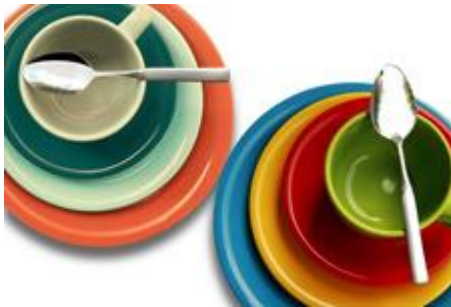
Bild 6: Geschirr.

Als Geschirr werden zum Beispiel Tassen, Teller oder Schüsseln bezeichnet.