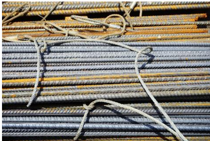
Bild 3: Eisenstangen.

Eisen ist ein Metall und hat eine silberne Farbe. Die Römerinnen und Römer erzeugten aus Eisen Werkzeuge und Waffen. In der Eisenzeit wurde das Eisen entdeckt. Es gab viele Gegenstände aus Eisen .