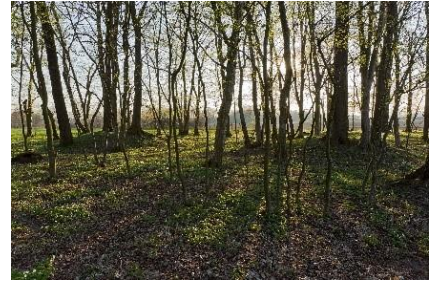
Bild 8: Römisches Hügelgräberfeld Hügelstaudach.

In Ratschendorf gibt es einen Friedhof aus der Römerzeit. Dort gibt es viele kleine Hügel. Jeder Hügel ist ein Grab. Dieser Platz heißt Hügelstaudach . Die Gräber sind etwa 2000 Jahre alt. Im Museum kannst du dir ein Grab ansehen.