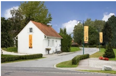
Bild 20: Römerzeitliches Museum Ratschendorf (Außenaufnahme).

Im römerzeitlichen Museum in Ratschendorf gibt es einen nachgebauten römischen Grabhügel.