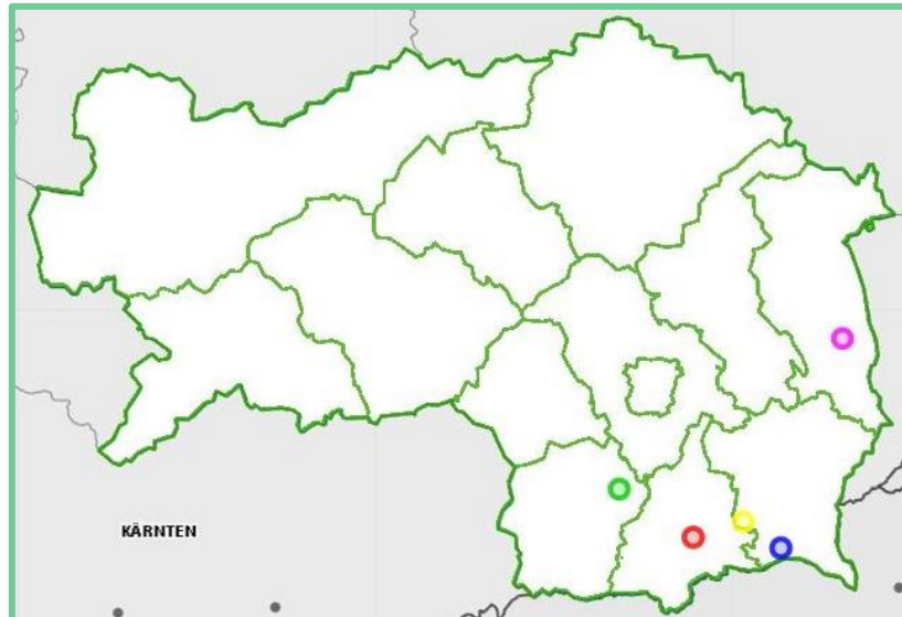
Bild 1: Wagna, Ratschendorf, Mettersdorf, Rannersdorf und Bad Waltersdorf in der Steiermark.