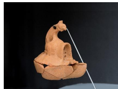
Bild 11: Öllampe in der Form eines Gladiatorenhelms.