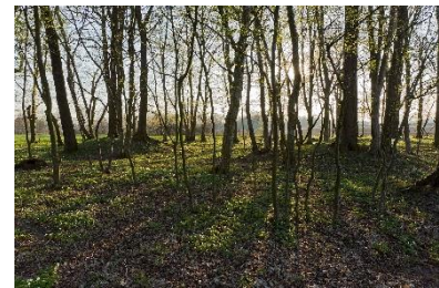
Bild 8: Römisches Hügelgräberfeld Hügelstaudach.

Vor einigen Jahren entdeckten Archäologinnen und Archäologen bei Ausgrabungen in Ratschendorf einen Friedhof aus der Römerzeit. Die Gräber sind ungefähr 2000 Jahre alt und sehen anders aus als Gräber heute. Der Friedhof ist ein Hügelgräberfeld und liegt in einem kleinen Wäldchen . Dort gibt es viele kleine Hügel und jeder Hügel ist ein Grab. Das Wäldchen heißt Hügelstaudach . Vor einigen Jahren öffneten Archäologinnen und Archäologen ein paar dieser Gräber. Wir wissen nun, dass in diesen Gräbern oft mehrere Menschen in einem Zeitraum von 100 Jahren begraben wurden. Ein solches Grab kannst du dir im Museum in Ratschendorf ansehen. Es ist ein Nachbau eines echten Grabes.