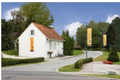
Bild 21: Römerzeitliches Museum Ratschendorf (Außenaufnahme).

Im römerzeitlichen Museum in Ratschendorf gibt es einen Raum, in dem ein Grabhügel nachgebaut wurde. Er wurde so nachgebaut, wie er im Wald Hügelstaudach wirklich gefunden wurde. Diesen Grabhügel kannst du besichtigen. Die Grabbeigaben, die die