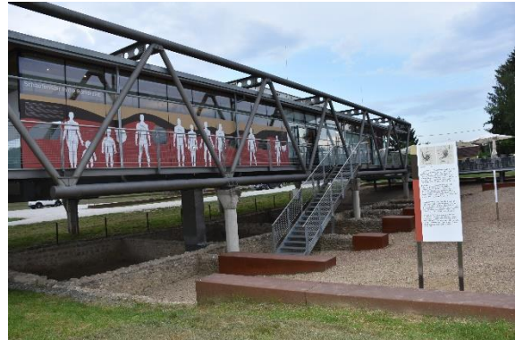
Bild 7: Das Pavillonsgebäude und das Freigelände Flavia Solva.