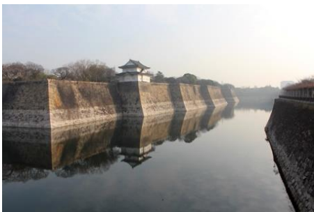
Bild 3: Burggraben.

Ein Burggraben ist eine Grube rund um die Burg. Der Burggraben schützt die Burg vor Feindinnen und Feinden. Um die Riegersburg herum gibt es zwei Burggräben . Auf dem Foto siehst du einen Burggraben .