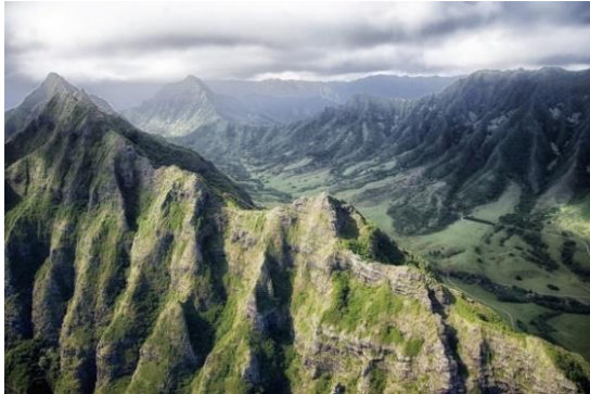
Bild 16: Tal.

Ein Tal liegt zwischen zwei Bergen. Das Tal liegt immer tiefer als die Landschaft rundherum. Auf dem Foto siehst du Berge. Zwischen den Bergen liegt das Tal .