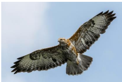
Bild 5: Falke.

Falken sind mittelgroße Greifvögel. Auf dem Foto siehst du einen Falken .