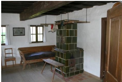
Bild 11: Kachelofen.

Ein Kachelofen ist ein Ofen im Haus. Außen sind Kacheln . Die Kacheln sehen aus wie Fliesen. Die Menschen heizen einen Kachelofen meistens mit Holz. So wird es im Haus schön warm. Auch heute haben manche Menschen noch einen Kachelofen zuhause.