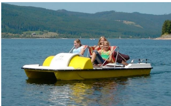
Bild 4: Tretboot.

Ein Tretboot ist ein kleines Boot. Damit das Boot sich bewegt, musst du wie beim Fahrrad treten. Das heißt dann Tretboot . Auf dem Bild siehst du ein Tretboot .