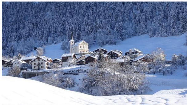
Bild 2: Dorf.

Ein Dorf ist wie eine sehr kleine Stadt auf dem Land. Dort leben weniger Menschen als in einer Stadt.