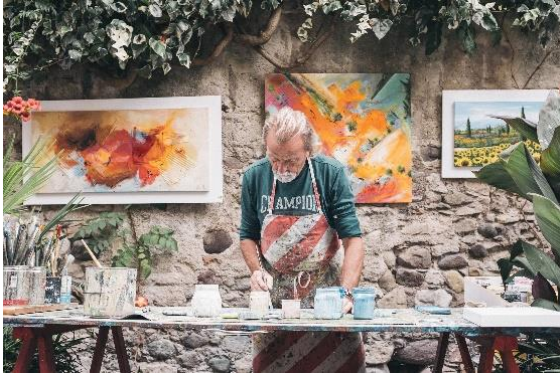
Bild 7: Ein Künstler malt ein Bild.

Künstlerin und Künstler ist ein Beruf. Künstlerinnen und Künstler malen ein Bild oder erfinden ein Musikstück. Das Bild und das Musikstück sind Kunst .