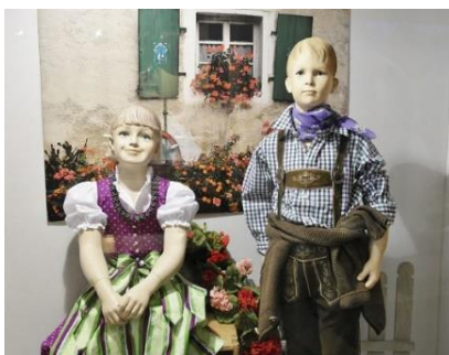
Bild 13: Tracht.

Die steirische Tracht ist eine Kleidung, die Menschen in der Steiermark zu besonderen Anlässen anziehen. Eine Lederhose oder ein Dirndlkleid gehören zur steirischen Tracht . Auf dem Bild siehst du die steirische Tracht .