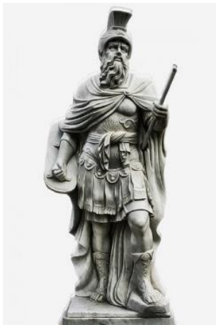
Bild 12: Statue.

Statuen sind meist Figuren von Menschen, Tieren oder Engeln. Eine Statue besteht oft aus Stein. Auf dem Bild siehst du eine Statue .