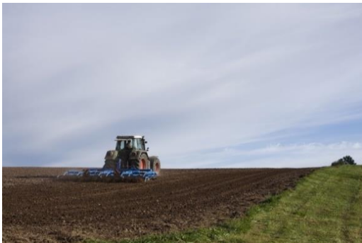
Bild 2: Ackerbau.

Auf einem Acker werden Pflanzen angebaut. Die Bäuerin oder der Bauer arbeitet am Acker , damit alles gut wachsen kann. Das nennt man Ackerbau .