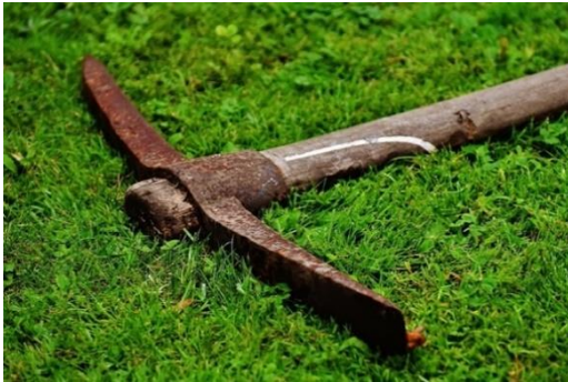
Bild 1: Spitzhacke.

Wenn du Steine aus einem Berg aushaust, dann kannst du dazu auch abbauen sagen. Der Stein wird dann vom Berg abgebaut . Dafür kannst du zum Beispiel eine Spitzhacke nehmen. Auf dem Bild siehst du eine Spitzhacke. Johann wollte den Abbau des Erzes leichter machen.