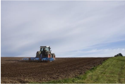
Bild 1: Ackerbau.

Auf einem Acker werden Pflanzen angebaut. Die Bäuerin oder der Bauer arbeitet am Acker , damit alles gut wachsen kann. Das nennt man Ackerbau .