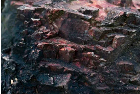
Bild 5: Eisenerz.

Erz ist ein besonderer Stein. Es gibt verschiedene Arten von Erz. Eine davon ist Eisenerz . Daraus wird dann Eisen gemacht. Das brauchst du zum Beispiel für Werkzeuge. Auf dem Bild siehst du das rot-schwarze Eisenerz .