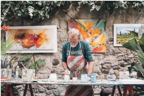
Bild 6: Ein Künstler malt ein Bild.

Künstlerin und Künstler ist ein Beruf. Künstlerinnen und Künstler malen ein Bild oder erfinden ein Musikstück. Das Bild und das Musikstück sind Kunst .