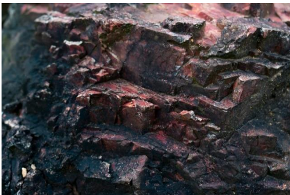
Bild 5: Eisenerz.

Erz ist ein besonderer Stein. Es gibt verschiedene Arten von Erz. Eine davon ist Eisenerz . Daraus wird dann Eisen gemacht. Das brauchst du zum Beispiel für Werkzeuge. Auf dem Bild siehst du das rot-schwarze Eisenerz .