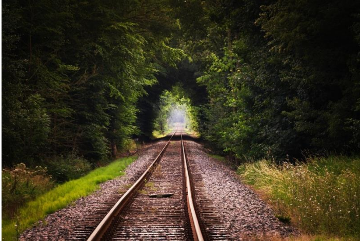
Bild 4: Eisenbahnschienen.

Züge fahren auf Schienen. Diese sind aus Eisen gemacht. Darum heißen sie Eisenbahnschienen . Auf dem Bild siehst du Eisenbahnschienen .