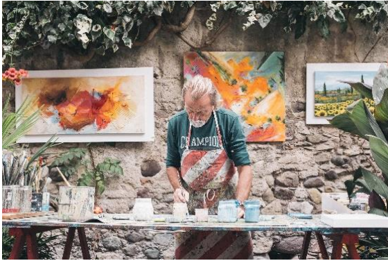
Bild 6: Ein Künstler malt ein Bild.

Künstlerin und Künstler ist ein Beruf. Künstlerinnen und Künstler malen ein Bild oder erfinden ein Musikstück. Das Bild und das Musikstück sind Kunst .