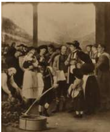
Bild 7: Erdäpfelverteilung. Gemälde eines Kammermalers.

Er sprach viel mit den Bäuerinnen und Bauern. Sie redeten über die Viehzucht , über den Anbau von Obst oder über den Ackerbau .