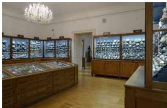
Bild 13: Mineraliensaal des Naturkundemuseums mit den Originalvittrinen Erzherzog Johanns.

Es gibt auch Gebäude, die an den Erzherzog erinnern. Er gründete eine Lehranstalt (eine Art Schule), in der man viel über den Bergbau lernen konnte. Aus dieser Lehranstalt wurde später die Montanuniversität Leoben .