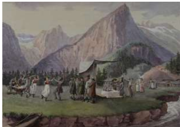
Bild 8: Ländliches Fest von Erzherzog Johann. Jakob Gauermann.