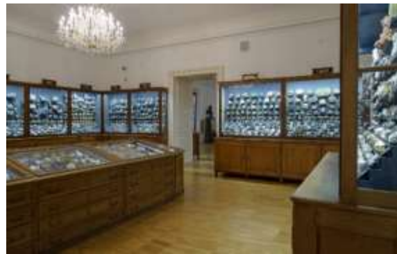
Bild 13: Mineraliensaal des Naturkundemuseums mit den Originalvitrinen Erzherzog Johanns.

Johann gründete auch das Universalmuseum Joanneum . Dort gibt es viele Ausstellungen über die Steiermark.