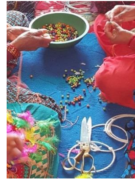
Bild 2: Produktion für Weltläden.