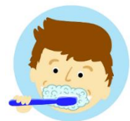
Bild 9: Zähneputzen.

Auch beim Zähneputzen solltest du das Wasser während des Putzens nicht laufen lassen.