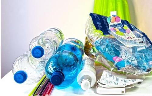
Bild 5: Müll aus Plastik.

Plastik ist ein Material. Viele Dinge bestehen aus Plastik . Zahnbürsten oder manche Flaschen bestehen zum Beispiel aus Plastik . Auf dem Bild siehst du Müll aus Plastik .