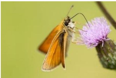
Bild 4: Schmetterling trinkt Nektar.

Wenn eine Pflanze blüht, dann wachsen auf ihr Blüten. In den Blüten ist der Nektar . Der Nektar ist sehr süß und klebrig (Mini Klexikon, 2020). Viele Insekten trinken gerne Nektar . Auf dem Bild siehst du einen Schmetterling, der Nektar trinkt.