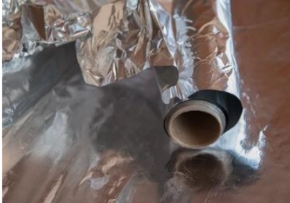
Bild 3: Alufolie.

Metall ist ein Material und kommt in der Natur vor. Gold, Silber und Eisen sind Metalle . Aus Metall werden zum Beispiel Dosen oder Alufolie hergestellt. Für Abfall aus Metall gibt es eine spezielle Mülltonne (Klexikon, 2021a). Auf dem Bild siehst du eine Alufolie.