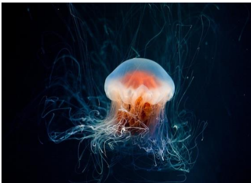
Bild 6: Qualle.

Quallen sind Tiere, die im Meer leben. Der Kopf einer Qualle sieht aus wie ein Luftballon. Ihre vielen Arme heißen Nessel. Quallen gehören zur Gruppe der Nesseltiere. Die Nesseln mancher Quallen enthalten Gift. So schützen sich Quallen vor Feinden (Klexikon, 2021). Auf dem Bild siehst du eine Qualle mit ihren Nesseln.