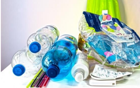
Bild 3: Müll aus Plastik.

Plastik ist ein Material. Viele Dinge bestehen aus Plastik . Zahnbürsten oder manche Flaschen bestehen zum Beispiel aus Plastik . Auf dem Bild siehst du Müll aus Plastik .