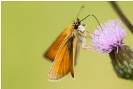
Bild 2: Schmetterling trinkt Nektar.

Wenn eine Pflanze blüht, dann wachsen auf ihr Blüten. In den Blüten ist der Nektar . Der Nektar ist sehr süß und klebrig (Mini Klexikon, 2020). Viele Insekten trinken gerne Nektar . Auf dem Bild siehst du einen Schmetterling, der Nektar trinkt.