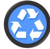
Bild 2: Recyclingkreislauf. (adaptiert)

Wenn du Kleidungsstücke hast, die nicht mehr gut genug sind, um sie weiterzugeben, kannst du sie zum Beispiel als Putzlappen verwenden oder etwas daraus basteln.