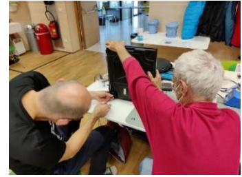
Bild 8: Gemeinsam werden elektronische Geräte repariert.

Du kannst auch Elektroschrott vermeiden. Versuche etwas zu reparieren. Du kannst auch in ein Repaircafé gehen. Im Internet steht, wo Repaircafés sind.