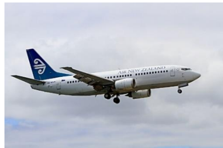
Bild 3: Der Elektroschrott in Österreich ist fast so schwer wie zwei Flugzeuge.