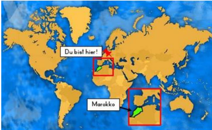
Bild 6: Marokko.

Marokko ist ein Land in Afrika. Afrika ist einer unserer sieben Kontinente. Auf der Karte siehst du, wo Marokko liegt.