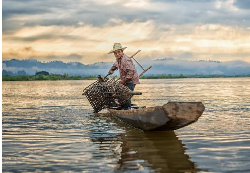
Bild 2: Fischer.

Das Wort Fang kommt vom Wort fangen . Wenn du beim Fischen einen guten Fang machst, dann hast du viele Fische gefangen. Du darfst aber nicht überall einfach so fischen. Meistens darfst du nur an bestimmten Orten fischen. Dort leben oft sehr viele Fische oder andere Meerestiere. Solche Orte heißen Fanggebiete .