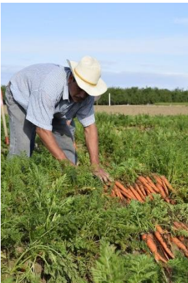
Bild 3: Ernte.

Bei der Ernte sammeln Menschen reifes Obst und Gemüse. Sie ernten Obst und Gemüse. Meistens machen Bäuerinnen und Bauern das mit einer Maschine. Manchmal ernten sie aber auch händisch. Der Bauer auf dem Bild erntet seine Karotte händisch.