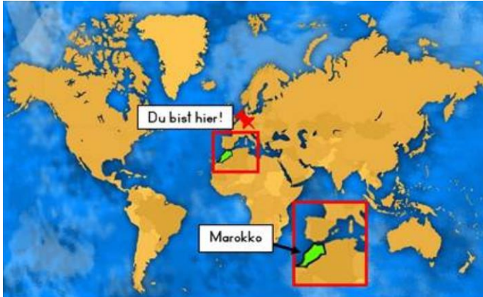
Bild 5: Marokko.

Marokko ist ein Land in Afrika. Afrika ist einer unserer sieben Kontinente. Auf der Karte siehst du, wo Marokko liegt.