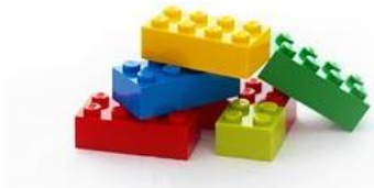
Bild 7: Bausteine aus Plastik.

Plastik ist ein Material. Viele Dinge bestehen aus Plastik . Zahnbürsten oder manche Flaschen bestehen zum Beispiel aus Plastik . Auf dem Bild siehst du Bausteine aus Plastik .