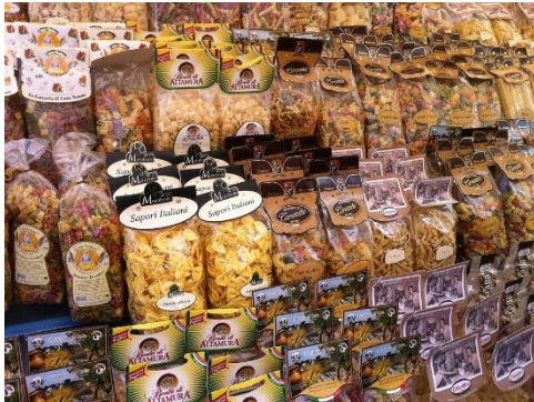
Bild 9: Verpackungen.

Wenn wir Lebensmittel kaufen, dann sind sie meist verpackt . Die Verpackungen sind zum Beispiel aus Plastik oder aus Karton. Durch diese Verpackungen entsteht viel Müll. In einem Unverpacktladen kannst du Lebensmittel lose kaufen. Das heißt, dass sie nicht eingepackt sind. Du bringst selbst eine Box oder eine Dose mit. Dort füllst du die Lebensmittel, die du brauchst, ein.