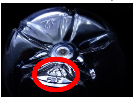
Bild 6: PET-Symbol auf einer Flasche.

PET ist eine Art von Plastik. Trinkflaschen sind oft aus PET . Statt einer PET -Flasche kannst du Mehrwegtrinkflaschen nehmen. Ob PET in einer Flasche ist, erkennst du am PET -Symbol. Auf dem Bild siehst du das PET -Symbol auf einem Flaschenboden.