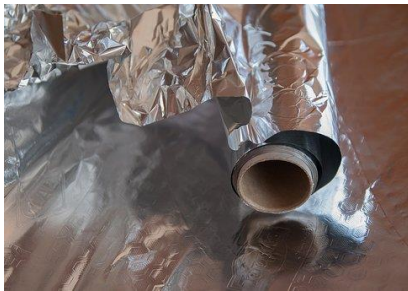
Bild 5: Alufolie.

Metall ist ein Material und kommt in der Natur vor. Gold, Silber und Eisen sind Metalle . Aus Metall werden zum Beispiel Dosen oder Alufolie hergestellt. Für Abfall aus Metall gibt es eine spezielle Mülltonne. Auf dem Bild siehst du eine Alufolie.