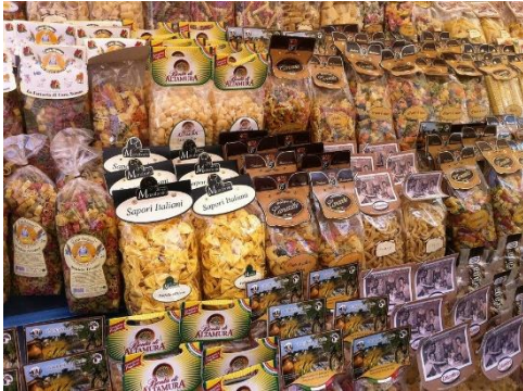
Bild 9: Verpackungen.

Wenn wir Lebensmittel kaufen, dann sind sie meist verpackt . Die Verpackungen sind zum Beispiel aus Plastik oder aus Karton. Durch diese Verpackungen entsteht viel Müll. In einem Unverpacktladen kannst du Lebensmittel lose kaufen. Das heißt, dass sie nicht eingepackt sind. Du bringst selbst eine Box oder eine Dose mit. Dort füllst du die Lebensmittel, die du brauchst, ein.