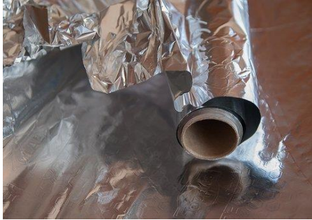
Bild 5: Alufolie.

Metall ist ein Material und kommt in der Natur vor. Gold, Silber und Eisen sind Metalle . Aus Metall werden zum Beispiel Dosen oder Alufolie hergestellt. Für Abfall aus Metall gibt es eine spezielle Mülltonne. Auf dem Bild siehst du eine Alufolie.