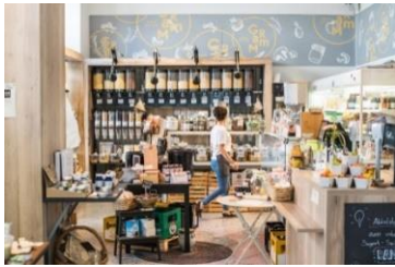
Bild 3: Unverpacktladen.

Du kannst Verpackungen vermeiden. Hast du schon einmal von „ Unverpacktläden “ gehört? Die Produkte sind dort nicht verpackt. Du musst selbst Behälter zum Einkaufen mitbringen. Die Produkte lagern in großen Kisten oder Gläsern. Von dort füllst du sie in deine Behälter. So kaufst du nur die Menge, die du brauchst.