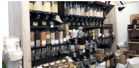
Bild 4: Lebensmittel in Gläsern im Unverpacktladen.

Das gilt natürlich für alle Dinge, die du kaufen kannst. Überlege gut, was du brauchst, bevor du etwas Neues kaufst. Brauchst du etwas nicht mehr, kannst du es verschenken oder spenden .