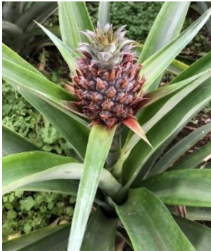
Bild 3: Bromeliengewächs.

Ein Gewächs ist eine Pflanze. Bromeliengewächse sind eine bestimmte Art von Pflanzen. Die Ananas ist ein Bromeliengewächs . Du kannst dazu auch Ananasgewächs sagen. Bromeliengewächse erkennst du an ihren langen dünnen Blättern. Außerdem sammeln die Blätter das Wasser in der Mitte der Pflanze. So kann die Pflanze lange Zeit ohne Wasser überleben. Auf dem Bild siehst du ein Bromeliengewächs .