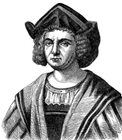
Bild 4: Christoph Kolumbus.

Christoph Kolumbus war ein Abenteurer aus Italien. Er reiste als erster Europäer zum Kontinent Amerika. Auf dem Bild siehst du Christoph Kolumbus .