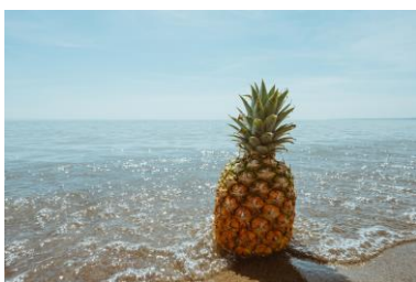
Bild 2: Ananas.

Ananas comosus ist der lateinische Name für Ananas . Eine Ananas ist eine Frucht. Das Innere der Ananas kannst du essen. Auf dem Bild siehst du eine Ananas .