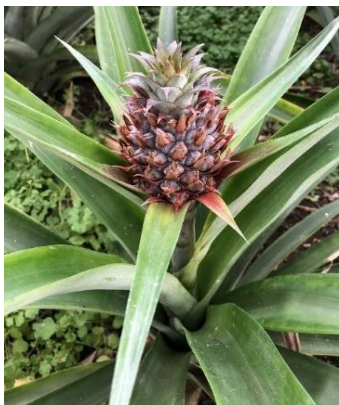
Bild 3: Bromeliengewächs.

Ein Gewächs ist eine Pflanze. Bromeliengewächse sind eine bestimmte Art von Pflanzen. Die Ananas ist ein Bromeliengewächs . Du kannst dazu auch Ananasgewächs sagen. Bromeliengewächse erkennst du an ihren langen dünnen Blättern. Außerdem sammeln die Blätter das Wasser in der Mitte der Pflanze. So kann die Pflanze lange Zeit ohne Wasser überleben. Auf dem Bild siehst du ein Bromeliengewächs .