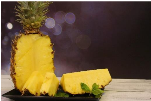
Bild 4: Fruchtfleisch.

Fruchtfleisch ist das Innere einer Frucht. Das Fruchtfleisch kannst du essen. Bei einer Ananas isst du das Fruchtfleisch . Das siehst du auf dem Bild.