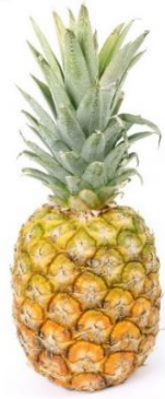
Bild 6: Ananaskrone.

Die grünen Blätter der Ananas sehen aus wie eine Krone . Deshalb heißen sie Krone . Auf dem Bild siehst du eine Ananas mit ihrer grünen Krone .