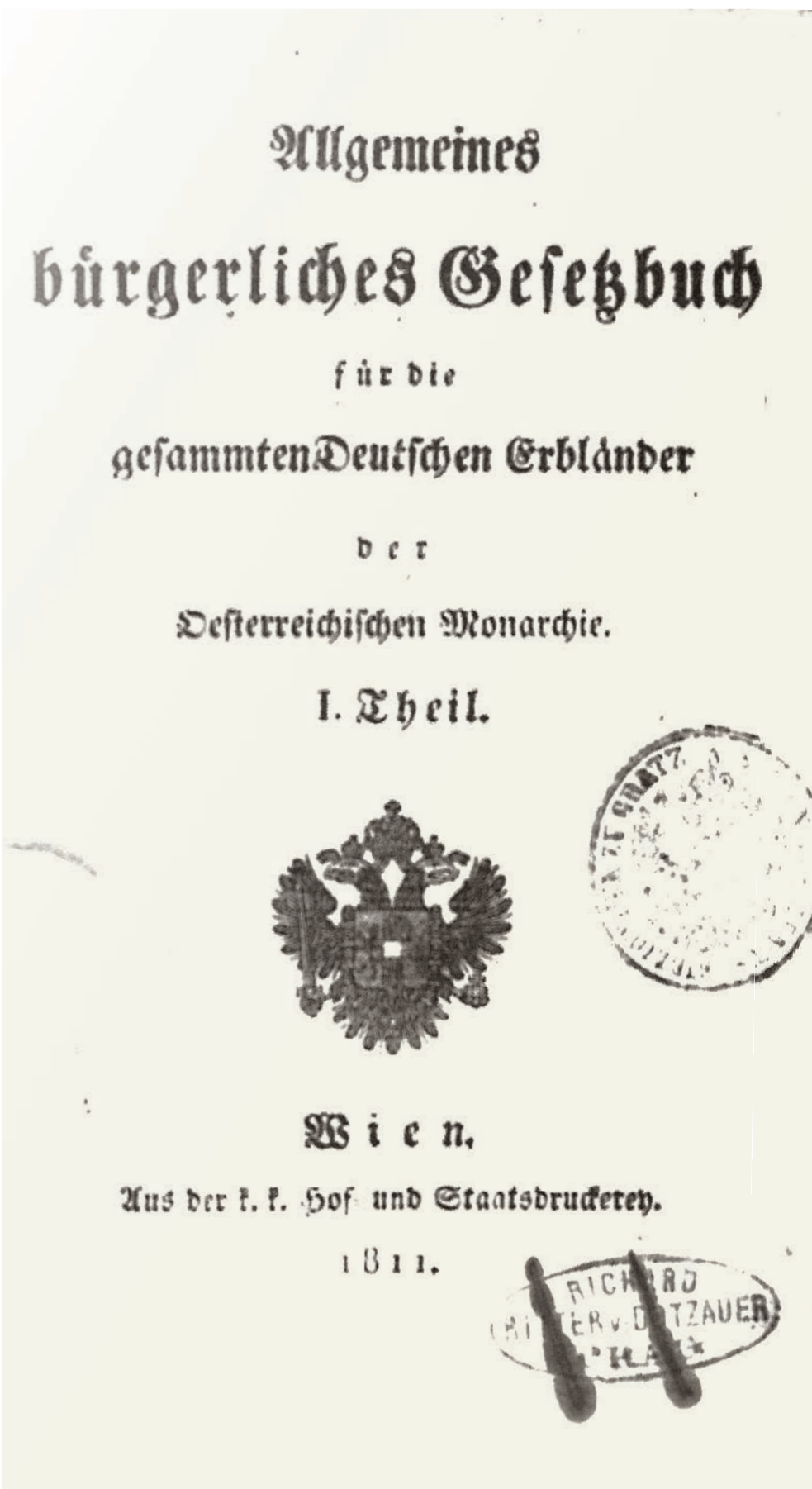
Ein großer Teil des ABGB stammt noch aus dem Jahr 1811. WissenschaftlerInnen der Uni Graz bringen den Kodex nun inhaltlich und sprachlich auf den neuesten Stand.