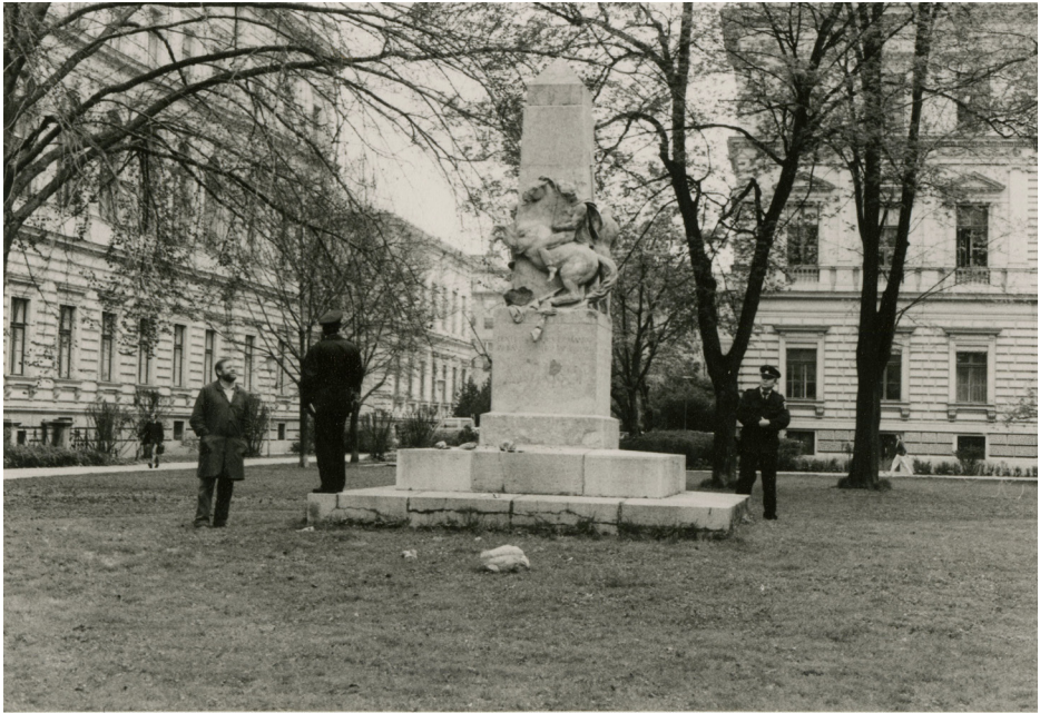
Bestandsaufnahme nach der Beschädigung des ehemaligen „Kriegerdenkmals“ am Campus der Universität Graz in den 1980ern.