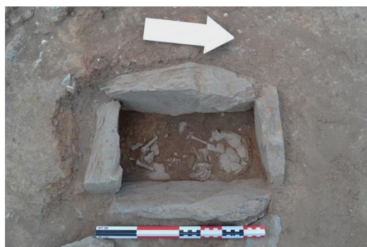
Abb. 4: Eines der Kindergräber in Fläche A1

In der dritten Bauphase wurde die Mauer der zweiten Phase abgetragen und neue Mauern wurden erbaut. Dabei wird an die abgetragene SSO-NNW verlaufende Mauer auch eine neue angebaut. Zwar konnte auch aus dieser Phase kein vollständiger Gebäudegrundriss ergraben werden, immerhin lässt sich sagen, dass es sich um ein mehrräumiges Gebäude mit Hofbereich handelt (Abb. 3). Im Hofbereich konnten vier Pfostenlöcher nachgewiesen werden, die parallel und östlich der neuen N-S verlaufenden Mauer liegen. Vermutlich trugen die Pfosten eine vordachartige Konstruktion. In diesen Bereich wurden in dieser Phase auch drei Kleinkinder bestattet. Zwei wurden in Hockerlage in mit Schieferplatten abgedeckten Steinkisten beigesetzt (Abb. 4). Etwas weniger aufwendig fiel die Bestattung des dritten Neugeborenen aus. Dieses wurde in eine flache Grube gelegt, die nur mit einer Steinplatte zugedeckt war. Beigaben wurden in keinem der Gräber gefunden. Zwischen den Gräbern konnte noch eine Aschengrube nachgewiesen werden – hier kann man spekulieren, ob die Feuerstelle in dieser Phase mit Totenritualen im Zusammenhang stand. Das Fundmaterial dieser Phase spricht für eine Datierung in die Stufe MH III (17. und 16. Jh. v. Chr.).