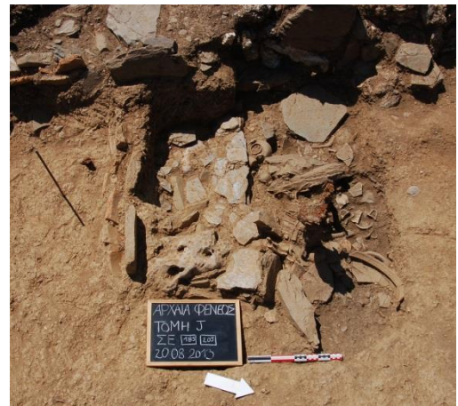
Abb. 6: Der Bothros in Fläche J

In der jüngeren Phase wurde eine rechteckige Grube in die Schicht, die über der älteren Phase liegt, eingetieft. Diese wird im Süden von 3 aufrecht stehenden Schieferplatten begrenzt. Im südlichen Teil liegt auch eine rechteckige „Steinbank“, die aus Schiefer und Kalkstein besteht. Ob diese Steinbank bereits in der älteren Phase vorhanden war, ist derweil noch nicht geklärt. Bei den Funden aus dieser Phase handelt es sich hauptsächlich um keramische Weihegaben. Dazu gehören unter anderem Skyphoi, Lekythoi, Pyxiden und Miniaturgefäße. Zu den weiteren Funden zählen auch noch Hydriskoi, Schalen, Lampen und Kochgefäße. Hervorzuheben ist an dieser Stelle noch ein Krater mit Ritzinschrift und ein ringförmiges Gefäß. Weiters wurden noch Teile von Terrakottastatuetten, Kleinfunde aus Bronze und Eisen, sowie einige Beingegegenstände gefunden. Nach der ersten Einschätzung dürfte die zweite Deponierungsphase in früh- bis hochklassische Zeit datieren.