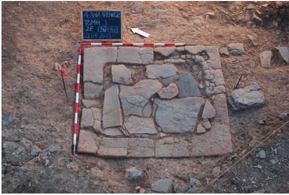
Abb. 5: Die Herdstelle (Eschara) in Fläche J

Teilbereich erfasst werden konnte. Dieser Temenosbereich liegt zwischen zwei in Richtung NW-SO verlaufenden Mauern, der Abstand zwischen den Mauern beträgt ca. 4 m. Im südöstlichen Teil dieses Bereiches liegt mittig eine Herdstelle (Eschara, Abb. 5). Der Befund besteht aus L-förmigen Ziegeln, die die Herdwandung bilden, als Herdoberfläche dienen Dachziegel und Bruchsteinplatten. Brandspuren weisen auf die ehemalige Hitzeeinwirkung hin. Nordwestlich von diesem Befund wurde eine rechteckige Stelenbasis freigelegt, die in dieselbe Schicht eingetieft war, wie die Herdstelle.