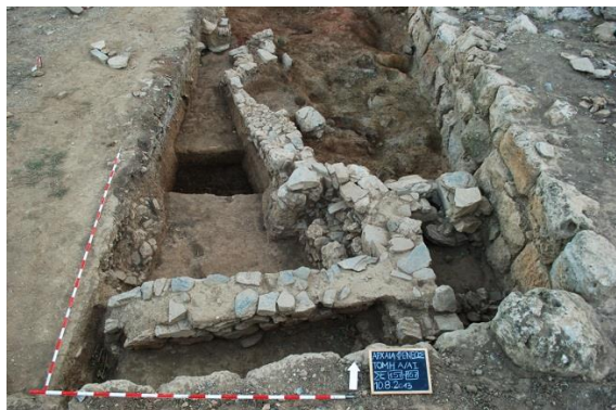
Abb. 3: Fläche A/Al von Süden

verfüllt waren. Die mit Feuer im Zusammenhang stehenden Handlungen dieser Phase dürften eher profaner Natur sein (Kochen, etc.). Bisherig ungeklärt ist ein weiterer Befund der ersten Phase: dabei handelt es sich um Vorratsgefäß, das in eine Grube gesetzt worden ist. Möglicherweise war die Mündung bei der Deponierung bereits beschädigt – zumindest fehlten bei der Ausgrabung Teile des Gefäßes aus dieser Zone. Das Gefäß war bis zur Hälfte mit Rollkieseln gefüllt, die am Akropolisberg nicht natürlich vorkommen.