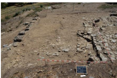
Abb. 7: Befunde in Fläche J auf der Innenseite der Stadtmauer

In dem Schnitt J wurden auch einige Befunde angetroffen, die mit der Stadtmauer, beziehungsweise mit deren Errichtung im Zusammenhang stehen. Auf der Innenseite der Stadtmauer wurde eine Wegpflasterung freigelegt, die aus Schieferplatten und Dachziegelbruch bestand (Abb. 7). Der Weg verlief von Ost nach West entlang der Stadtmauer und dürfte unmittelbar nach der Errichtung der Stadtmauer angelegt worden sein. Eine ähnliche Wegpflasterung wurde bereits 2011 und 2012 weiter östlich hangabwärts in den Flächen C und G freigelegt.