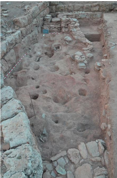
Abb. 2: Fläche A/A von Norden

In der Fläche A/AI (Abb. 2 und 3) wurden bereits im Vorjahr komplexe prähistorische Siedlungsbefunde angetroffen, die in der diesjährigen Kampagne weiter untersucht wurden. Die Fläche liegt auf dem Plateau des Akropolisügels, westlich der Kirche Hagios Konstantinos. Aus Zeitgründen konnte nicht die gesamte Fläche bis zum sterilen Boden untersucht werden. Soweit aber festgestellt werden konnte, ist der natürliche Fels in diesem Bereich stark zerklüftet.