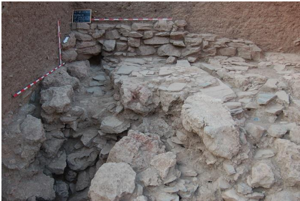
Abb. 8: Fläche H

ebenfalls parallel zur Stadtmauer verläuft (Abb. 7). Die aus Schiefnern gebaute Mauer wurde bisher auf einer Länge von 2,76 m freigelegt und ist 0,65 m breit. Bisher sind drei Lagen sichtbar (0,26 m), die Unterkante wurde noch nicht freigelegt. Die Datierung und die Frage ob diese Mauer in einem Zusammenhang mit der Stadtmauer steht, muss erst in der kommenden Kampagne geklärt werden.