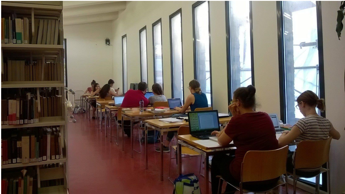
Die Bibliothek so voll wie selten zuvor.