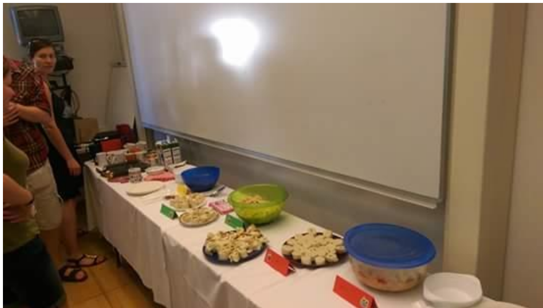
Erfrischungen für zwischendurch, um die grauen Zellen bei Stange zu halten