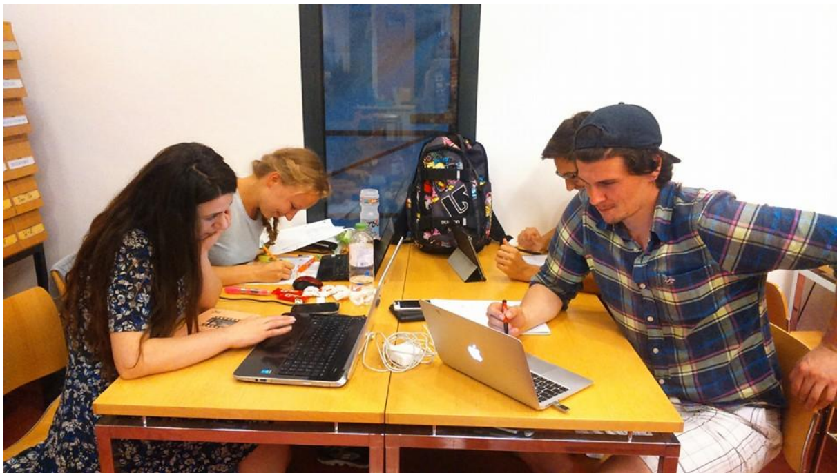
Konzentriertes Arbeiten in der Bibliothek