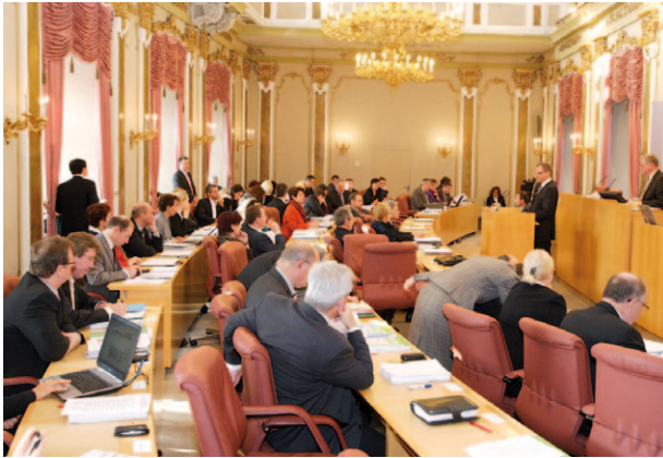
1) Sitzungssaal im Oberösterreichischen Landtag