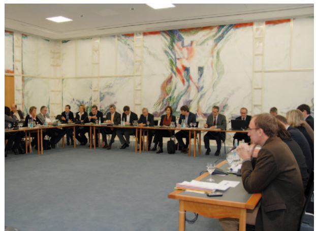
3) Integrationsausschuss im Vorarlberger Landtag

T Tabelle 4: Parteienszusammensetzung der Landtagsabgeordneten (Stand 01/07/2010)