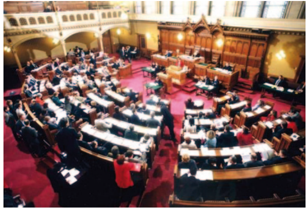
2) Sitzungssaal im Wiener Landtag

Parlamente sind ein zentrales Element in der Demokratie und es gibt sie daher auf allen Ebenen: auf der Ebene der Europäischen Union das Europäische Parlament (27 Mitgliedsstaaten, 736 Mitglieder), auf der Bundesebene in Österreich den Nationalrat (183 Abgeordnete) und den Bundesrat (62 Mitglieder), auf der Länderebene die Landtage der einzelnen Bundesländer (Gesamtzahl 448 Abgeordnete), auf der Gemeindeebene die Gemeinderäte/innen (insgesamt 42.248, Stand 2005) und in Wien und in Graz gibt es auch noch die Bezirksebene, wo in jedem Bezirk eine Bezirksvertretung als Bezirksparlament eingerichtet ist.