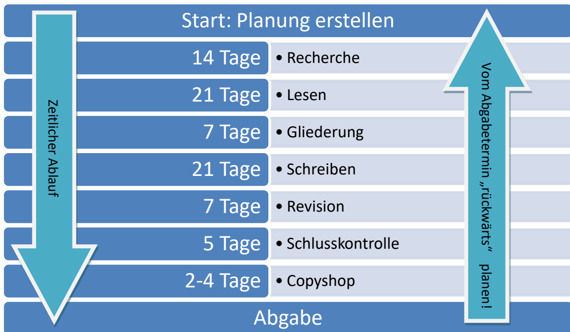
Abb. 1. Beispiel Zeitplanung. Nach (Haines, 2009, S. 93).

Das Exposé soll auch eine Zeitplanung enthalten. Unten finden Sie ein Beispiel, wie man dabei vorgehen könnte.