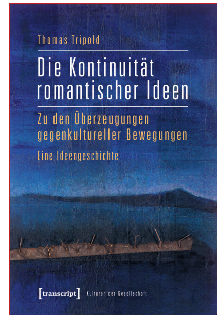
Thomas Tripold: Die Kontinuität romantischer Ideen. Zu den Überzeugungen gegenkultureller Bewegungen. Eine Ideengeschichte, Bielefeld: transcript Verlag (2012)