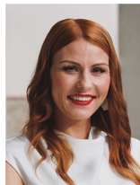
Mag. a LADECK