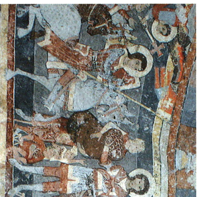
Das kulturelle Erbe wird für die Zukunft bewahrt. The cultural heritage is maintained for the future.