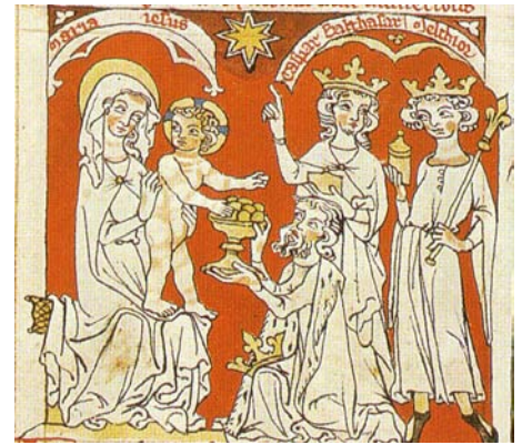
Diese Miniatur (aus dem Kremsmünsterer Codex 243) verstärkt die Textbotschaft