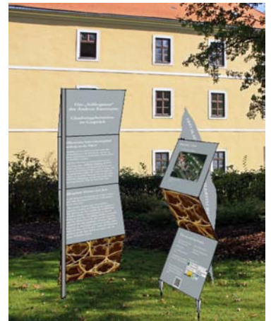
Entwurf: Theresa Zifko

Ein QR-Code führt zu weiteren Informationen auf der Literaturpfade-Homepage (z.B. mhd. Hörproben).