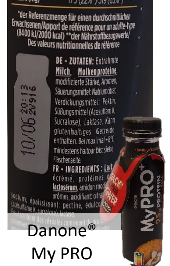
Danone® My PRO