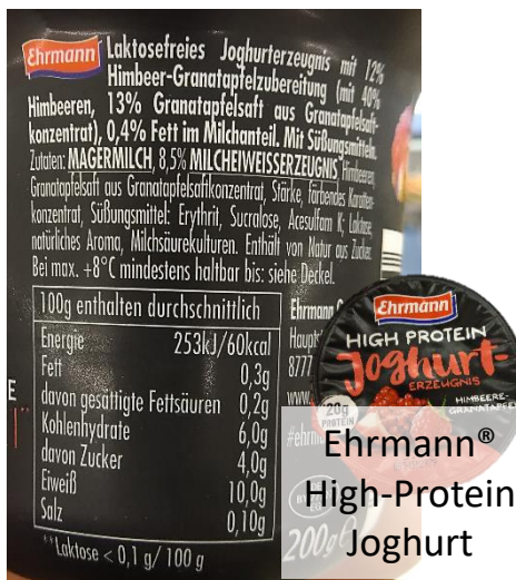
Ehrmann® High-Protein Joghurt