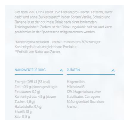
Nöm® Pro Proteindrink