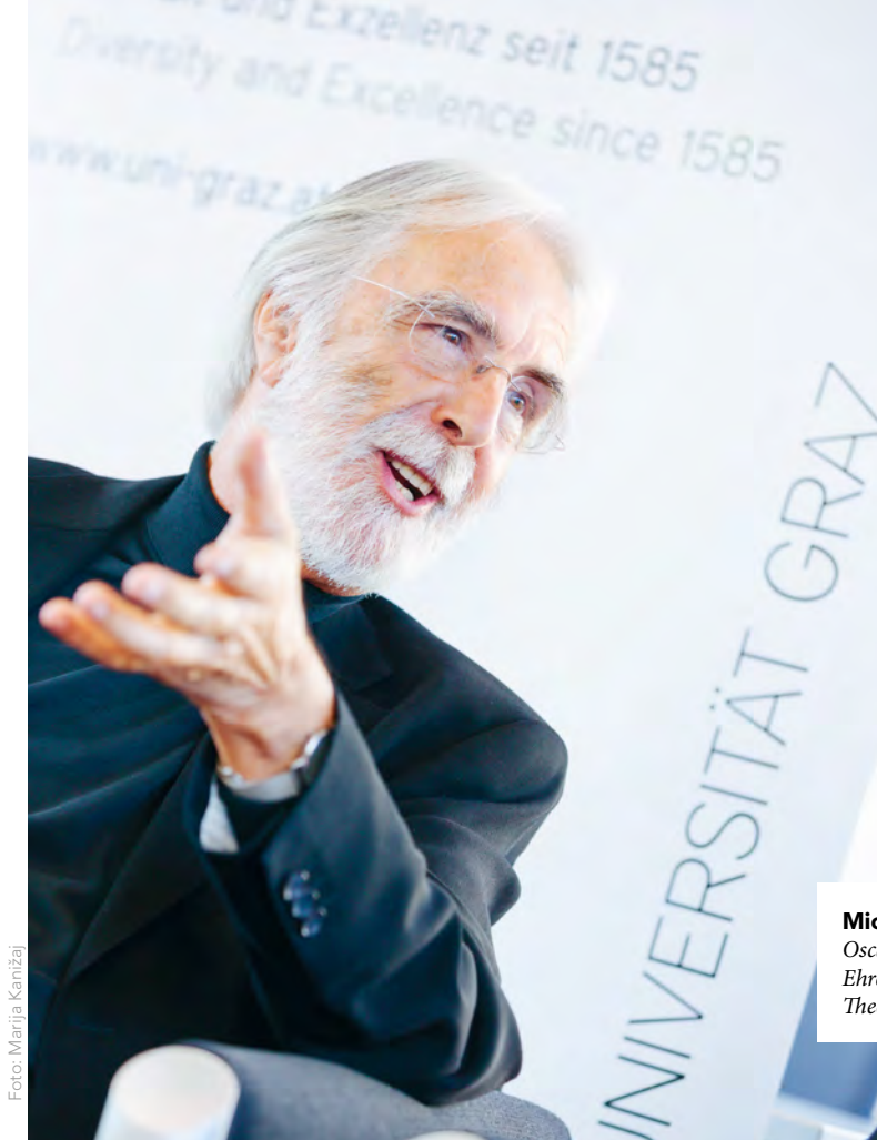
Michael Haneke ist Oscar-Preisträger und Ehrendoktor der Katholisch- Theologischen Fakultät