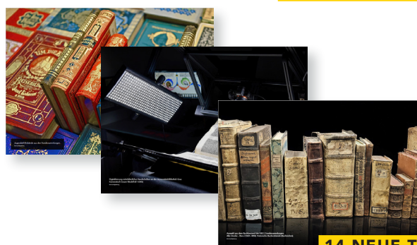
14 NEUE TAFELN