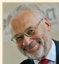
Dr. Erhard Busek

Präsident des Senats der Wirtschaft Österreich, ehem. Minister für Wirtschaft und Forschung, Minister für Unterricht und Vizekanzler der Republik Österreich