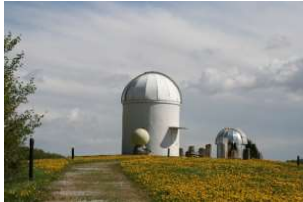
Bild 11: Die Sternwarte in Auersbach.

Hast du dich schon einmal gefragt, wie weit es etwa von der Erde bis zu einem anderen Planeten unseres Sonnensystems ist? Eine Antwort findest du sicher in der Sternwarte in Auersbach. Dort gibt es einen Planetenwanderweg, der dir die Entfernungen zwischen der Erde und den anderen Planeten veranschaulicht .