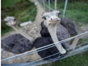
Bild 9: Strauße.