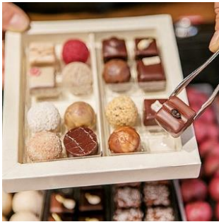
Bild 8: Pralinen.

Pralinen sind kleine Schokoladen. Oft sind Pralinen gefüllt mit einer Creme. Du kannst dir Pralinen als kleine Zuckerl aus Schokolade vorstellen. Auf dem Foto siehst du Pralinen .