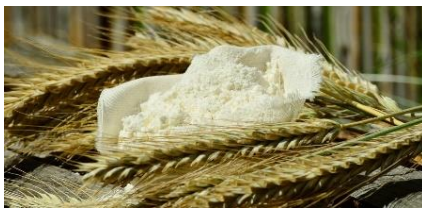
Bild 2: Mehl ( gemahlen).

Um Mehl zu machen, wird Getreide gemahlen . Das passiert in einer Mühle.