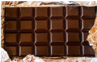
Bild 10: Schokoladentafel.

Wenn du im Supermarkt eine Schokolade kaufst, dann ist diese Schokolade meistens ein verpacktes großes Stück. Dieses große Stück heißt Tafel . Du kaufst also eine Tafel Schokolade. Auf dem Foto siehst du eine Schokoladentafel .